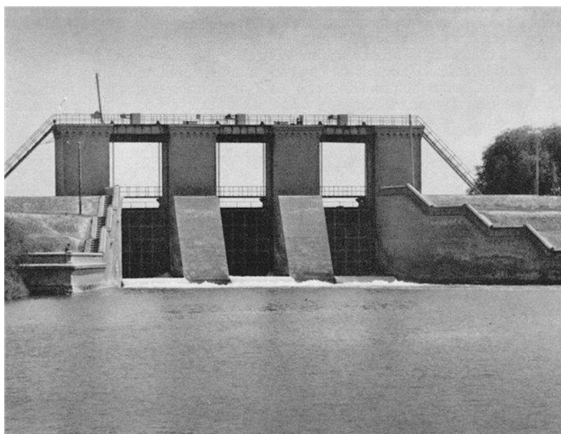
Здесь показана для сравнения современная фотография плотины из кн.: Памятники архитектуры Туркменистана. Л., Стройиздат ЛО, 1974, с. 269.